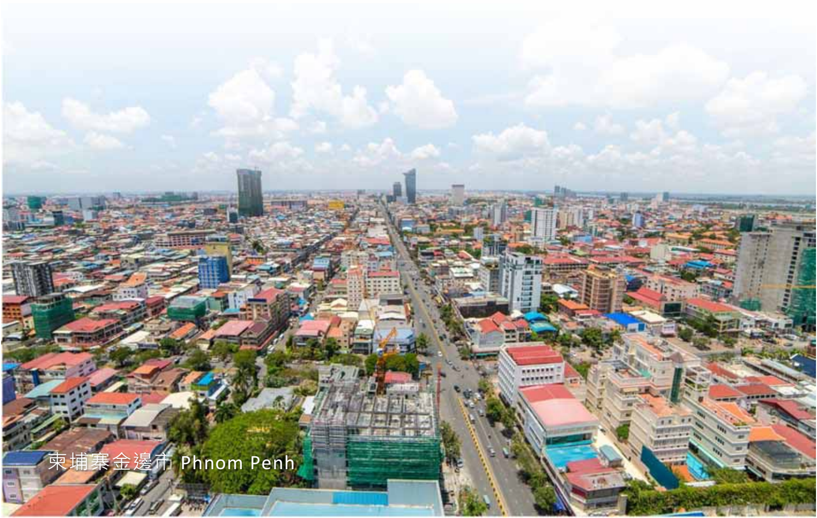
柬埔寨金邊市 Phnom Penh